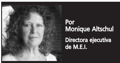
Por Monique Altschul Directora ejecutiva de M.E.I.

En 2013, nuestras actividades se centraron en la prevención de las violencias de género y la discriminación: organizando, comunicando, participando.